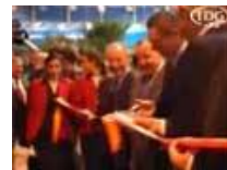
Alberto Ruiz- Gallardón inaugura SIMO 2007