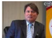
Habemus director general de Steria España