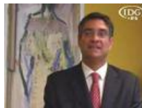
Buenos resultados de HP en servidores y almacenamiento