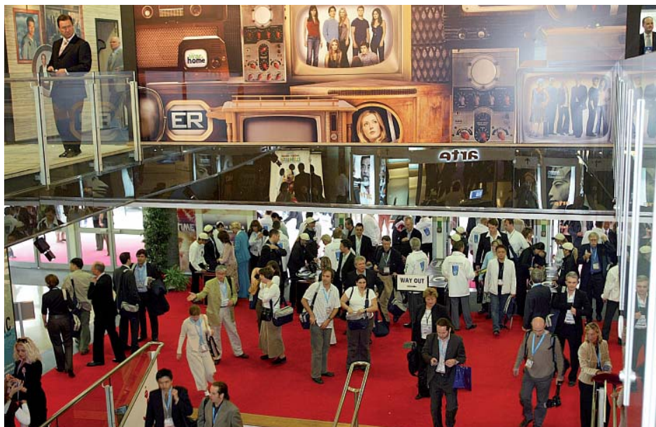
Imagen de la edición 2005.

Eusko Jaurlaritzako Kultura Sailarekin lan-kidetzan, Eiken harremanetan jarri zen ICEX-FAPAErekin, Euskadiko Ikus-entzunezkoen Sektoreak azokan izango duen partaidetza pertsonalizatuko eredia definitzeko. Klusterraren helburua zen ikus-entzunezkoen sektorearekin erlaziozko enpresa, erakunde eta organizazio ugariaren presentzia ahalbi-