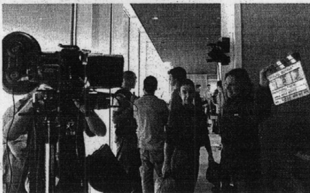
EikenBank elegirá al ganador entre 27 proyectos.

EikenBank es una acción diseñada desde las empresas asociadas, que tiene como principal objetivo poner en contacto de forma directa al talento no profesional con las empresas del sector audiovisual