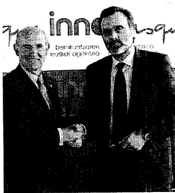
Firma de acuerdo entre InnoBasque y Bizkaia: xede