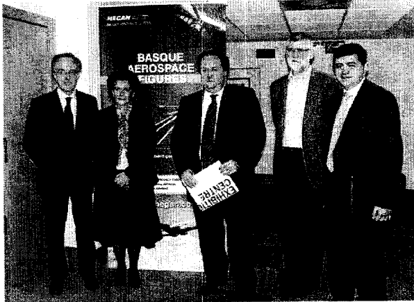
Aerotrends: Congreso de Nuevas Tendencias del Sector Aeroespacial y Encuentro de Negocios