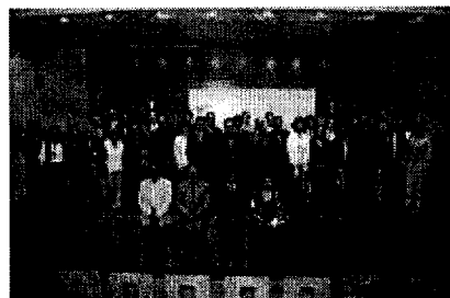
Imagen de los participantes en el acto de firma del compromiso con el desarrollo sostenible.

Representantes de un total de 45 empresas y entidades del Parque Tecnológico de Bizkaia firmaron ayer un compromiso con la sostenibilidad, en un acto celebrado en el propio Parque de Zamudio. Tras la lectura del documento y la presentación de las actividades del Foro liderado por el Parque Tecnológico de Bizkaia, creado hace año y medio, se animó a todas las empresas y entidades a adherirse a esta iniciativa.