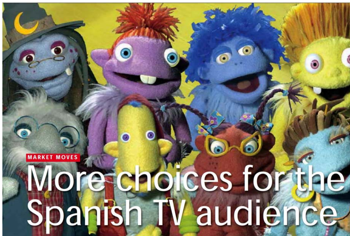
Kids' show Los Lunis, a big hit for RTVE

THE SPANISH AUDIOVISUAL LANDSCAPE IS UNDERGOING RADICAL CHANGE. AUDIENCE FRAGMENTATION, CHANGING VIEWING HABITS, NEW PLATFORMS AND FRESH COMPETITION ARE PRESENTING OPPORTUNITIES THAT THE TERRITORY IS KEEN TO EMBRACE. GARY SMITH REPORTS