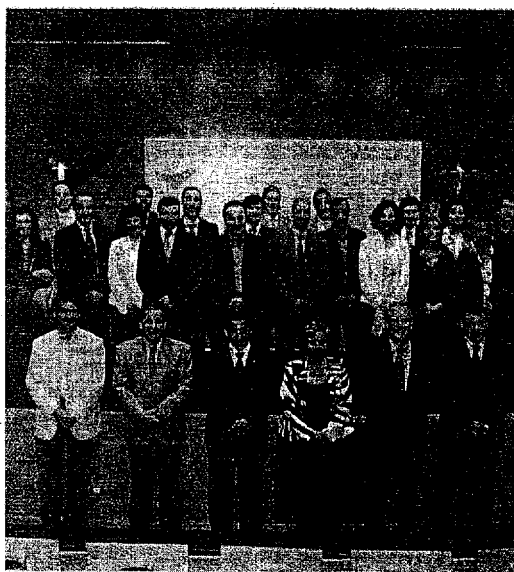
Las empresas firmantes han animado a las demás a comprometerse.

A estas empresas se suman las que se han adherido en el acto fir-